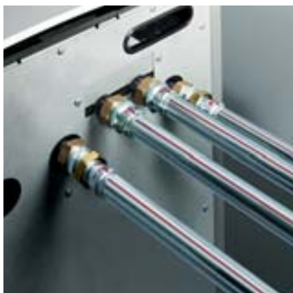
Raccordement de la chaudière : canalisations de départ et de retour avec Prestabo.