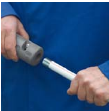
L'outil de dénudage Viega sert à dénuder la gaine extérieure blanche du tube Prestabo.

Viega a mis au point des outils qui excellent par leur convivialité et leur fiabilité à toute épreuve pour travailler avec Prestabo : l'outil de dénudage permet de retirer la gaine PP blanche des tubes pour les installations apparentes. Et, les machines à sertir Viega vous permettent de réaliser des raccords sûrs en quelques secondes.