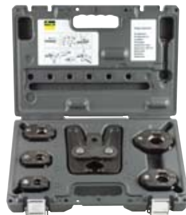
Pour les dimensions de 15 à 35 mm : mâchoire articulée à articulation brevetée et cinq anneaux de sertissage. Existe également en 42 et 54 mm.