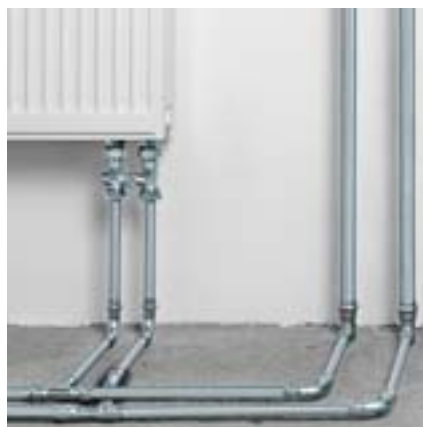
Prestabo est synonyme de polyvalence pour les installations de chauffage.